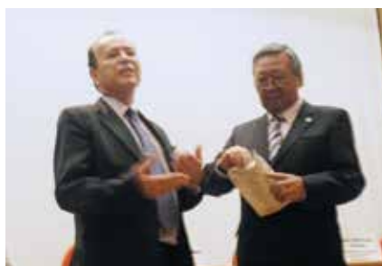
Abrava homenageia presidente da Cetesb

O evento foi patrocinado pelas empresas: Bandeirantes Refrigeração, DuPont, Frigelar, Mipal, Vulkan e Zeon. [a]