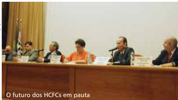
O futuro dos HCFCs em pauta