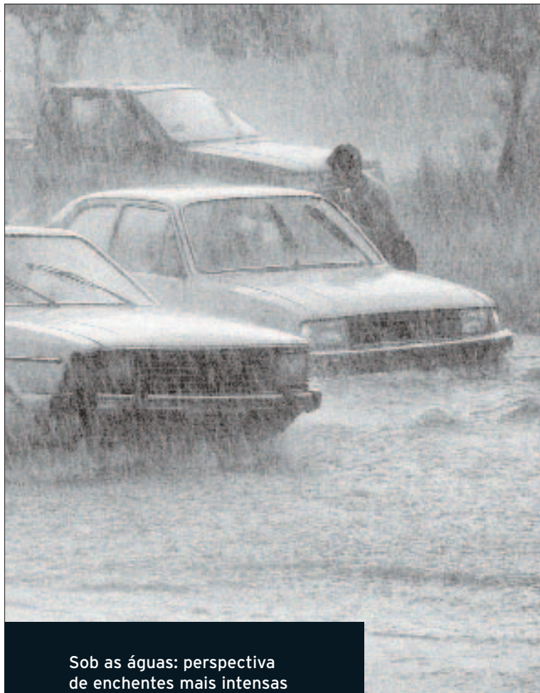
Sob as águas: perspectiva de enchentes mais intensas nas próximas décadas

norte do Amazonas equivalente ao estado de São Paulo o aquecimento pode chegar a 6°C. Essas projeções referem-se ao cenário otimista, que pressupõe o cumprimento integral das metas de redução de poluição do Protocolo de Kyoto. Nesse caso, tudo seria feito para evitar os danos do aquecimento global.