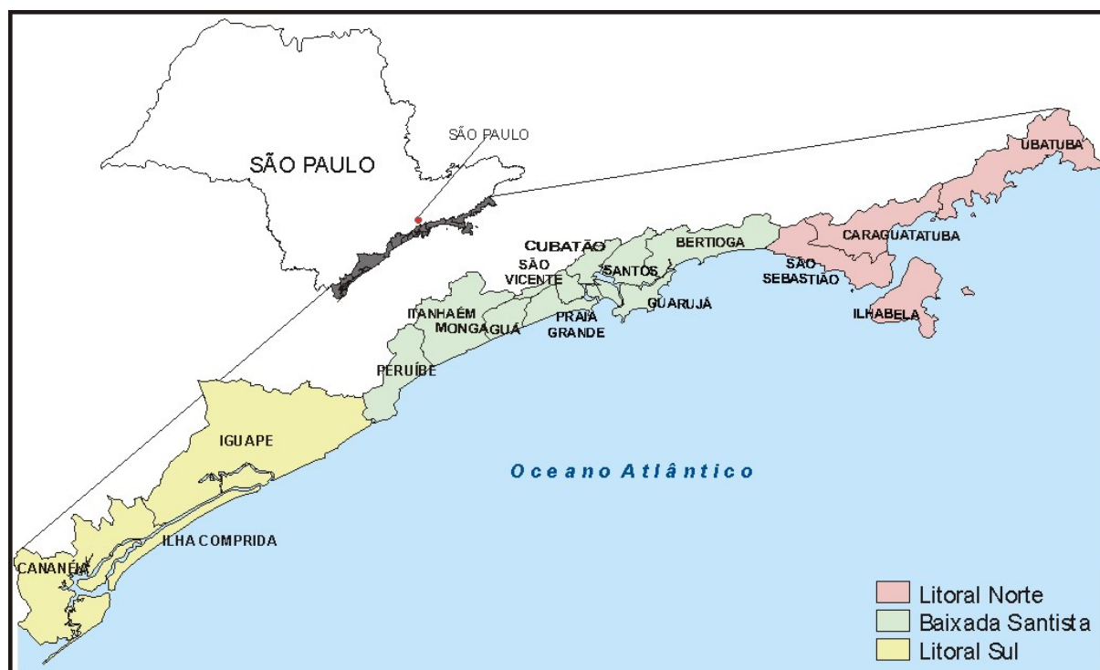
Mapa 1 – Municípios do Litoral Paulista

O litoral de São Paulo possui cerca de 880 km de extensão de linha de costa e abrange 16 municípios, com área total de 7.759 km 2 . As três UGRHs (Unidades de Gerenciamento de Recursos Hídricos) que englobam os municípios do litoral são: Litoral Norte (UGRHI 3), Baixada Santista (UGRHI 7) e Ribeira do Iguape/Litoral Sul (UGRHI 11) (Mapa 1). A Tabela 1 mostra as áreas dos municípios litorâneos e a extensão da linha de costa de cada um.