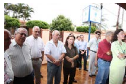
Diversos segmentos da cidade estiveram representados na inauguração