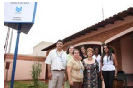
A equipe da nova Agência

Texto Newton Miura