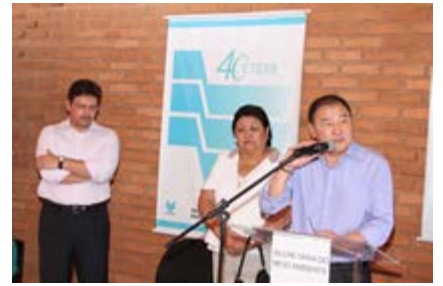
O prefeito da cidade ressaltou a importância do órgão ambiental