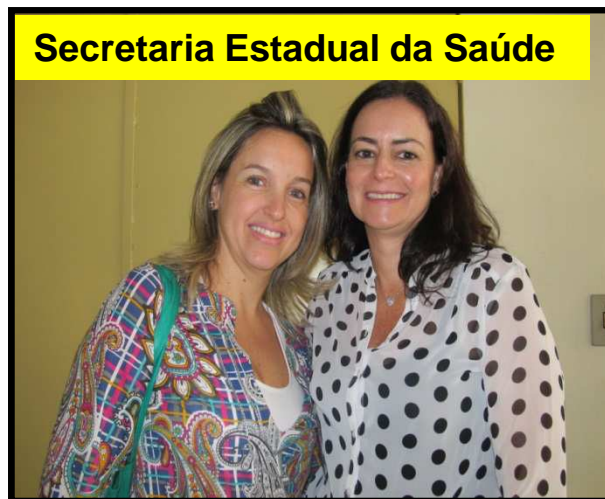
Secretaria Estadual da Saúde