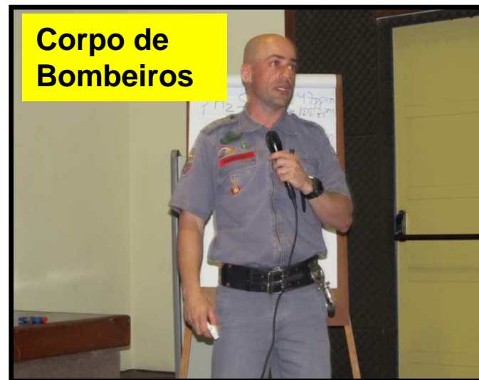
Corpo de Bombeiros