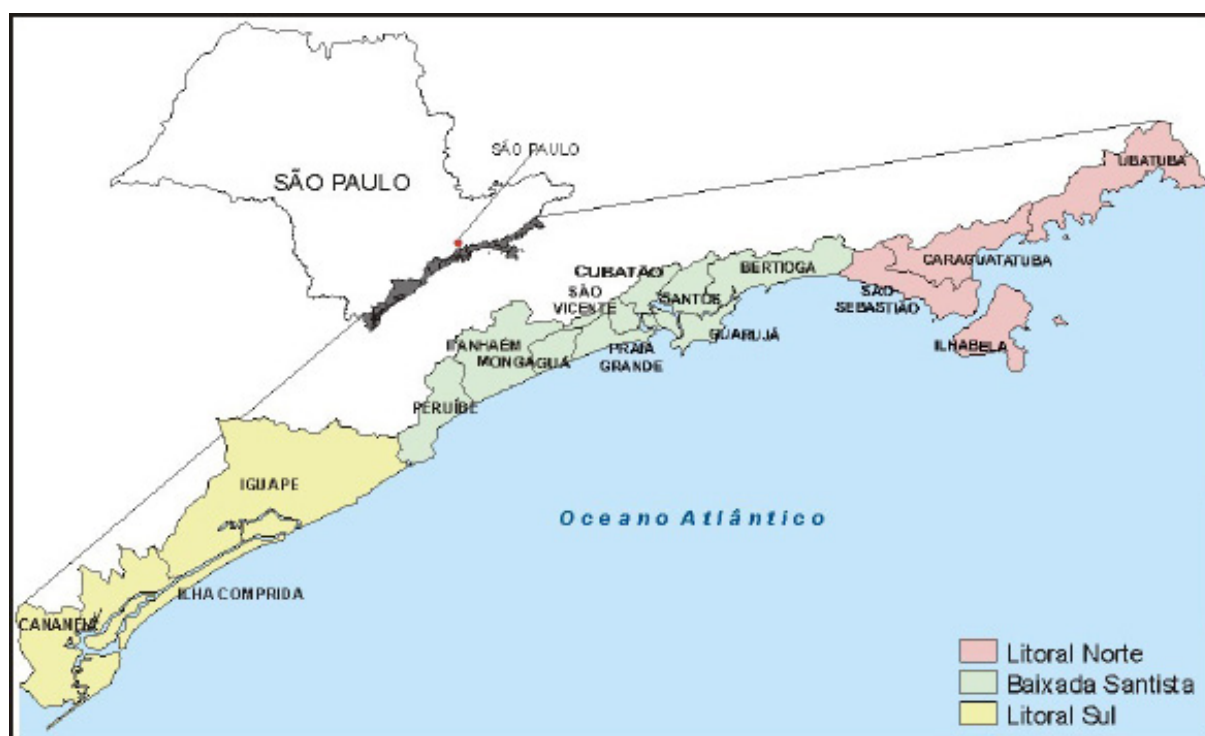
Mapa 1 – Municípios do Litoral Paulista

O litoral de São Paulo possui cerca de 880 km de extensão de linha de costa e abrange 16 municípios, com área total de 7.759 km 2 . As três UGRHs (Unidades de Gerenciamento de Recursos Hídricos) que englobam os municípios do litoral são: Litoral Norte (UGRHI 3), Baixada Santista (UGRHI 7) e Ribeira do Iguape/Litoral Sul (UGRHI 11) (Mapa 1). A Tabela 1 mostra as áreas dos municípios litorâneos e a extensão da linha de costa de cada um.